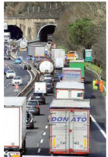
Due immagini della coda chilometrica sull'Autosole